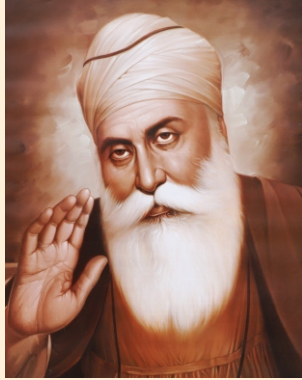
ਸ੍ਰੀ ਗੁਰੂ ਨਾਨਕ ਦੇਵ ਜੀ