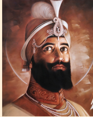
ਸ੍ਰੀ ਗੁਰੂ ਗੋਬਿੰਦ ਸਿੰਘ ਜੀ